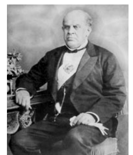
Domingo Faustino S.

SARMIENTO, DOMINGO FAUSTINO. Nació en San Juan (Argentina) el 15 de febrero de 1811 y murió en Asunción del Paraguay el 11 de septiembre de 1888. Educador, escritor, político. Opositor a Rosas, se refugió en Chile (1840). Desarrolló su tesis en sentido de que la Argentina estaba desgarrada por la lucha entre la civilización y la barbarie y de que sólo podía regenerarse gracias a la escuela que no debía hacer distinción entre "plebeyos y decentes". Cuando tenía 34 años de edad, el ministro chileno Manuel Montt lo envió a Europa a estudiar los sistemas educacionales. Viaja a los Estados Unidos de Norte América y traba amistad con Horacio Mann y su esposa María Peabody, campeones de la educación popular. Durante el resto de su vida se dedicará a crear escuelas inspiradas por las enseñanzas y el ejemplo de Mann. En 1865 Mitre lo designa, plenipotenciario extraordinario en Chile, Perú y EEUU. En 1868, presidente de la Argentina. Gran admirador de los EEUU y su forma federal de gobierno, tuvo influencia en las ideas y la enseñanza bolivianas.