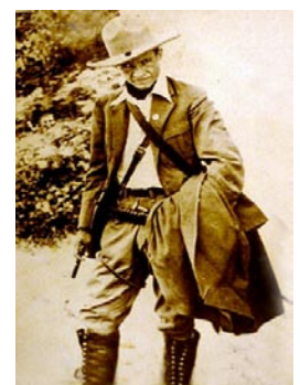
Augusto César Sandino