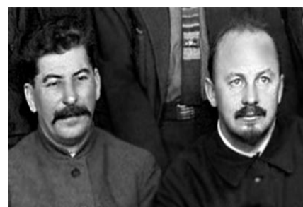
Stalin y Bujarin

STALIN Y BUJARIN. Las relaciones entre Bujarin y el todopoderoso Stalin oscilaron con las ideas que ambos defendieron. Aliados primero. en 1924, cuando Bujarin defendía la Nueva Economía Política, que Stalin utilizaba para minar a Trotsky y Zínoviev, se convirtieron en enemigos a partir de 1928, en que el dictador dio marcha atrás y reforzó la colectivización que antes defendían sus enemigos. Bujarin fue denunciado por oponerse a los planes de Stalin, perdió su cargo en el Komintern y fue expulsado del Politburó. No sirvió que se retractara y que Stalin hiciera el gesto de readmitirle. En enero de 1937 fue detenido y expulsado del Partido Comunista por trotskysta. En marzo de 1938 se le juzgó por "actividades contrarrevolucionarias y de espionaje" y fue condenado y ejecutado, antes Bujarin envió a Stalin