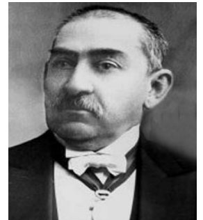
Juan Misael Saracho

SARACHO, JUAN MISAEL. Nació en Tarija el 27 de enero de 1857 y murió en Tupiza el 1º. de octubre de 1915. Abogado, profesor, político, liberal. Fundador de la Sociedad Secreta "El Porvenir". Concurrió a la Guerra del Pacífico. Catedrático universitario. Vicepresidente de la Convención Nacional de 1900. Senador por Tarija. Ministro de Relaciones Exteriores. De 1904 a 1908 fue ministro de Instrucción. Presidente del Congreso en 1915. Segundo vicepresidente del gobierno Montes (1913). En sus ideas no se apartó de la concepción liberal. Según los comentaristas, se le deben "Las Bases Pedagógicas de la Instrucción Primaria, apoyadas en Programas científicamente elaborados".