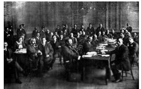
Segunda Internacional, congreso 1913

SEGUNDA INTERNACIONAL. (Socialdemocracia). En la octava década del siglo XIX los partidos obreros se habían desarrollado de manera amplia, aunque extremadamente desigual. Este avance del movimiento socialista permitió la estructuración de la Segunda Internacional. En Francia, Jules Guesde (1845-1922) contribuyó a la organización del Partido Obrero en 1882. En Rusia actuaba desde 1883 el grupo "Emancipación del Trabajo", que se transformó en el Partido Obrero Socialdemócrata Ruso; fundado por Jorge Plejanov (1856-1918) y Axelrod (1850-1928). En Noruega, el partido fue puesto en pie en 1887. En Austria y Suiza en 1888. En Suecia en 1889. En España, Pablo Iglesias organizó el Partido Socialista Obrero en 1879. En Italia funcionaba un partido obrero.