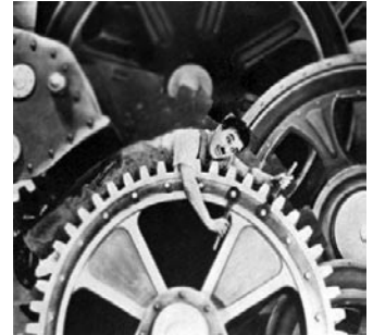
Salario. Fuerza de trabajo y precio