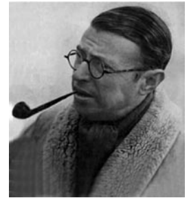
Jean Paúl Sartre

SARTRE, JEAN PAÚL. Nació en 1906 y murió en París el 15 de abril de 1980. Filósofo y literato, tuvo activa militancia política en el Partido Comunista Francés y en las filas del maoísmo. Premio Nóbel de Literatura en 1964. Rompió con el PCF a raíz de la invasión rusa a Checoslovaquia. El existencialismo tuvo poca influencia en Bolivia.